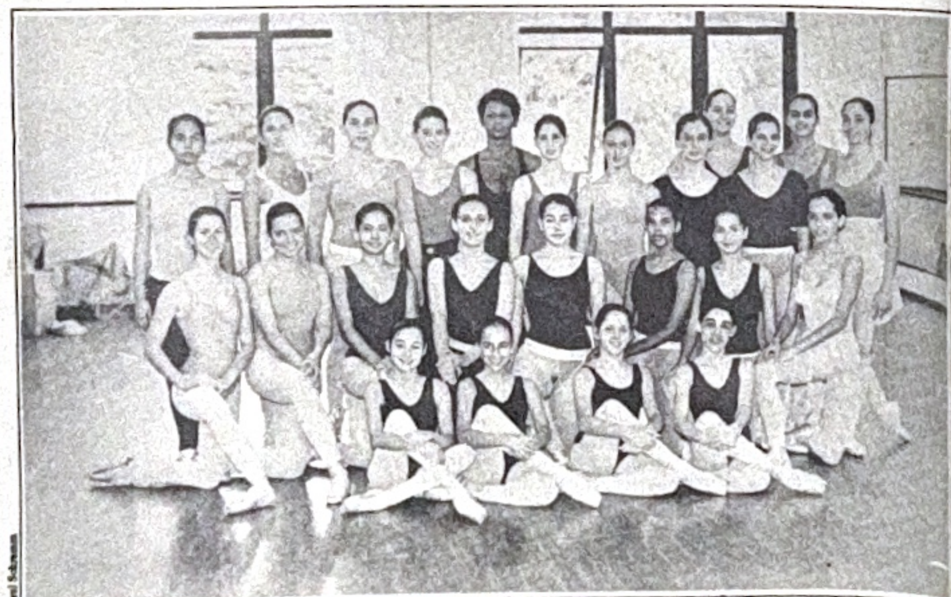
Integrantes do Balé Isadora Duncan, de Campo Grande, em pausa dos ensaios na academia