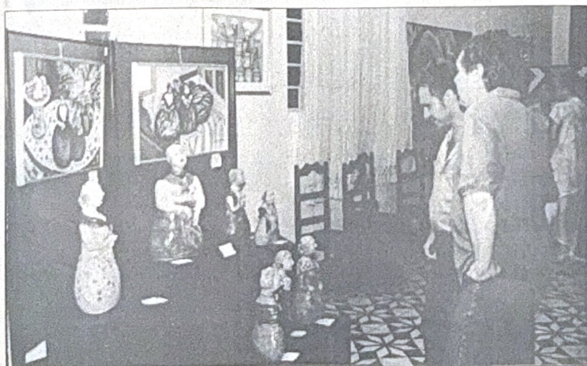
Cerâmicas pintadas e telas das mais variadas tendências foram mostradas ao exigente público presente

A exposição conta com o apoio cultural da iniciativa privada e órgãos públicos e permanece aberta à visitação em horário comercial até o dia 02 de fevereiro (rua Estevão Alves Corrêa, 195).